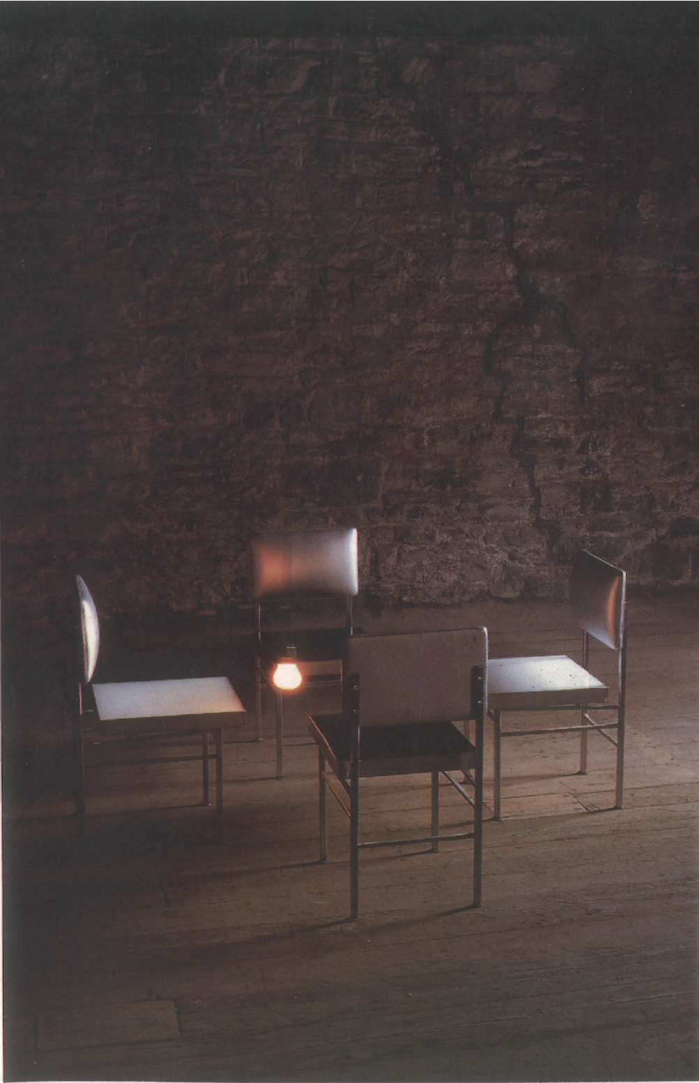
王功新 不可坐的椅子 奶 墨水 马达 灯 1995年 于纽约端德·杨克艺术空间