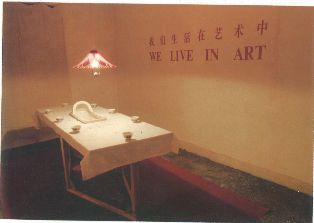
王蓬 我们生活在艺术中 木桌 桌布 茶杯 小便池 文字 1994年