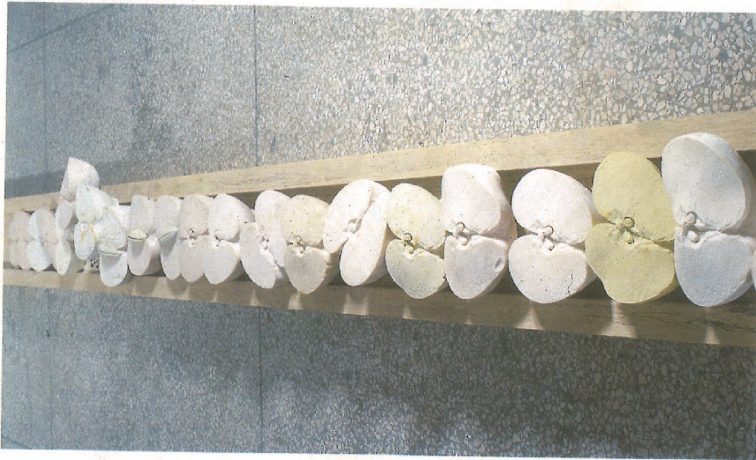
张新 苹果被切开会后的状态 石膏模塑 木 1988年