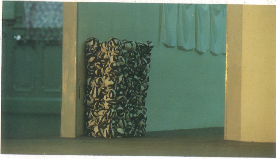
王南溟 纸盒 (局部) 宣纸 墨 1985年