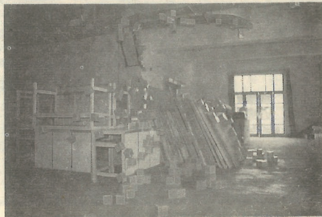
倪卫华 连续连续扩散事态——'92 纸盒 1992 年