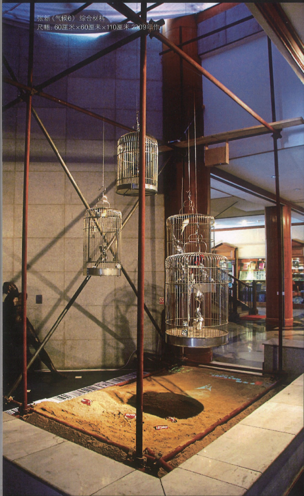
张新《气候6》 综合材料 尺幅：60厘米×60厘米×110厘米 2009年作

化的说辞来进行解读，会心者看出来历，不过会心一笑，迟钝者不明所以，也不影响对作品的欣赏。没有故弄玄虚的文化符号，更没有人为制造的阅读障碍；不排斥“当代艺术”普遍的审美意味，更不会掩盖艺术家鲜明的个人气质。