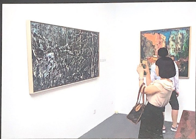
位于上海市铜仁路的安簪艺术空间以一场名为“访古：安簪艺术空间开幕展”的精彩展览正式亮相沪上。

“‘当代艺术家’对待‘古’，该持有一个什么态度呢？我以为仍是一个‘访’字。”在黄剑看来，这个“访古”不是古人那种饥不择食地寻访古迹，更不“国学热”驱动下的故作好古地走访猎奇，而是从文化认同和语言探索出发，在“古”中访求最契合自身性情禀赋和艺术气质的元素：可以是一种技巧、一种题材，也可以是一种图式、一种面貌，但更应该是一种情绪、一种气韵、一种格调、一种境界。所谓“万物过眼、即为我所有”，“古”要为我所有并为我所用，这一眼必定是电光火石、相看不厌的。所“访”之古最终在作品中呈现出来的反倒不是浓郁的“古意”，而是“古质”不失“今妍”，“古朴”而不“乖时”，“古风”而不“同弊”，“古拙”而不“荒率”。无需依靠传统艺术那一套程式