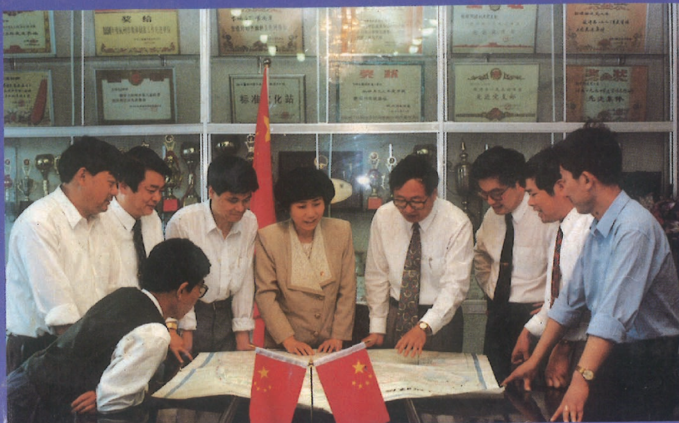
街道党政班子正在研究朝晖“九五”发展计划