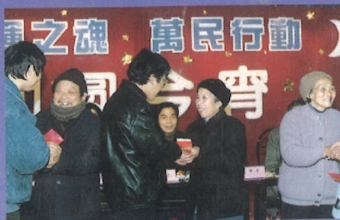
万民行动团圆今宵