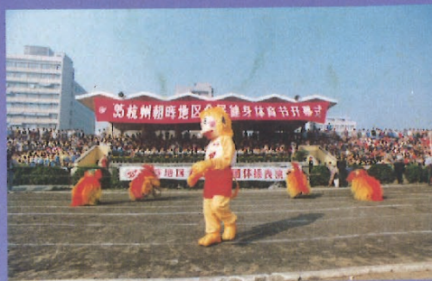
'95朝晖地区全民健身节开幕式场景

地处钱塘江边、西子湖畔、古运河端的杭州朝晖街道,占地 2.92 平方公里, 居住着 18,000 余户住户, 是目前杭州面积最大、人口最多的新村街道。