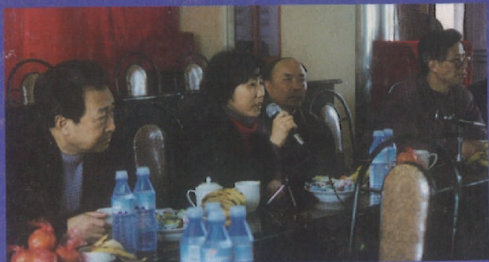
浙江省委书记李泽民(右二)、副书记刘枫(左一)、杭州市委书记李金明(右一)视察了朝晖街道