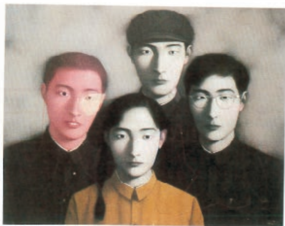
大家庭 No. 2 张晓刚 布上油彩 150cm×170cm 1996年 ..... P163

张盛泉(大同大张, 1955—2000), 生于河北。先后在北京、重庆、贵阳、大同居住。行为艺术家。